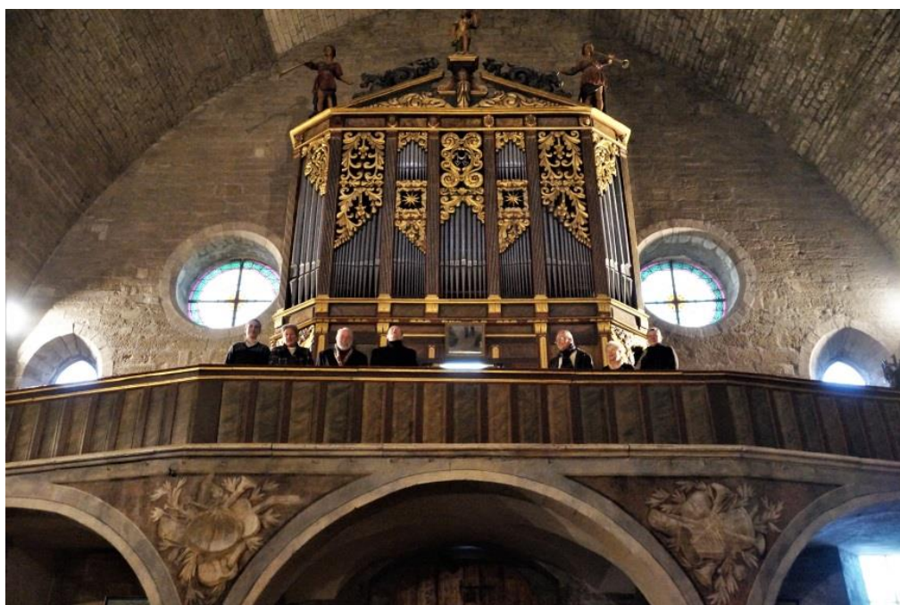
Les organistes sur la tribune de l'orgue